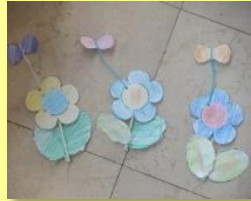
「ちぎる」「むすぶ」「はる」「ぬる」「ねじる」等、全ての巧緻性を一つの作品に取り入れた製作を致します。