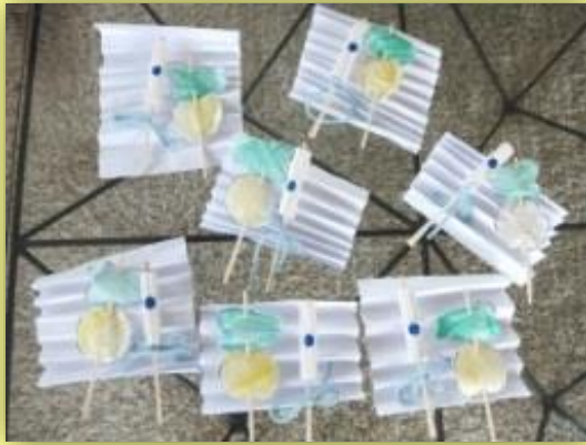
2012年度の過去問をアレンジした製作です。